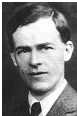
George Douglas Howard Cole