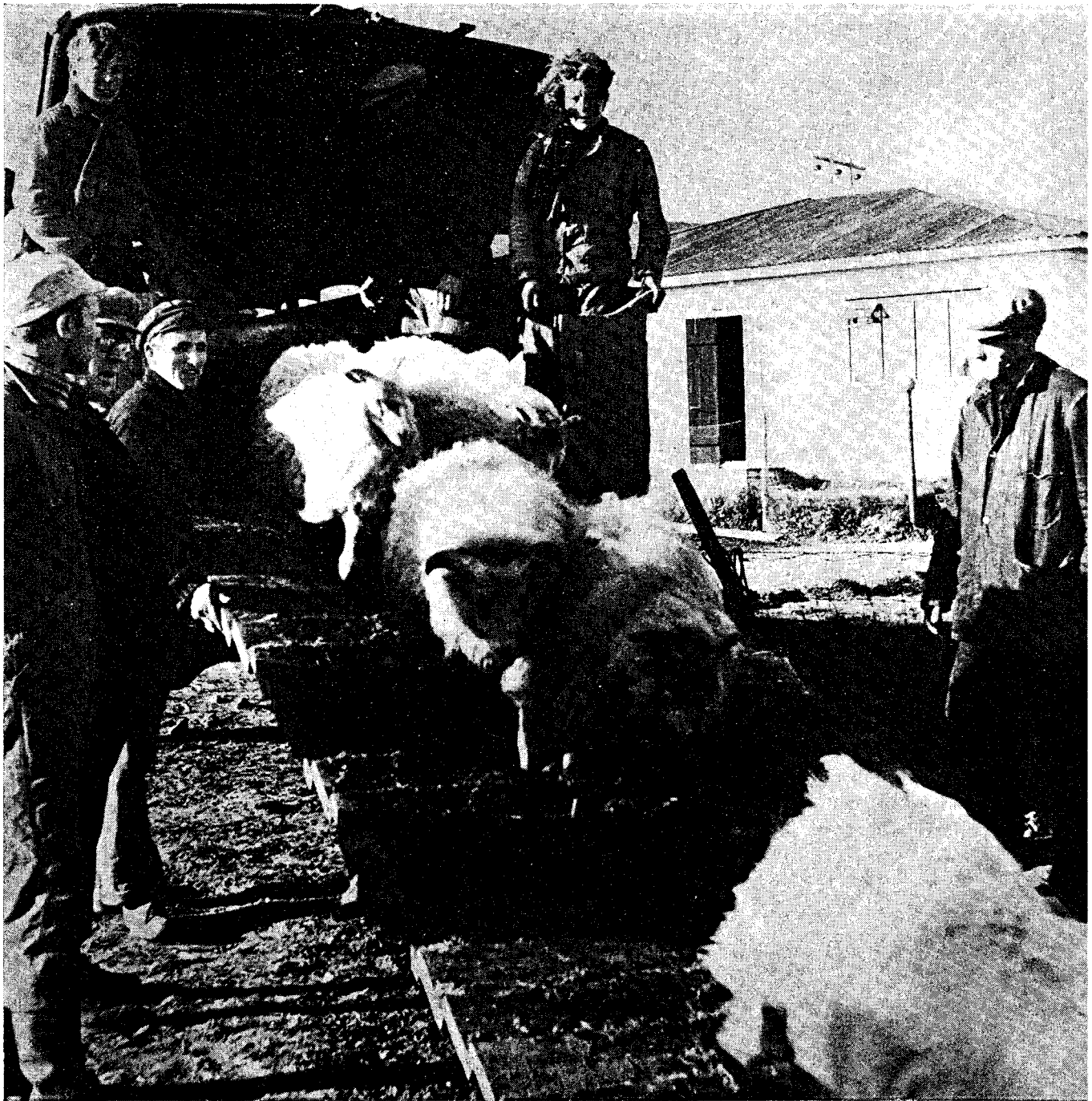
flutningar. — ynd eftir Guðna Þarson).